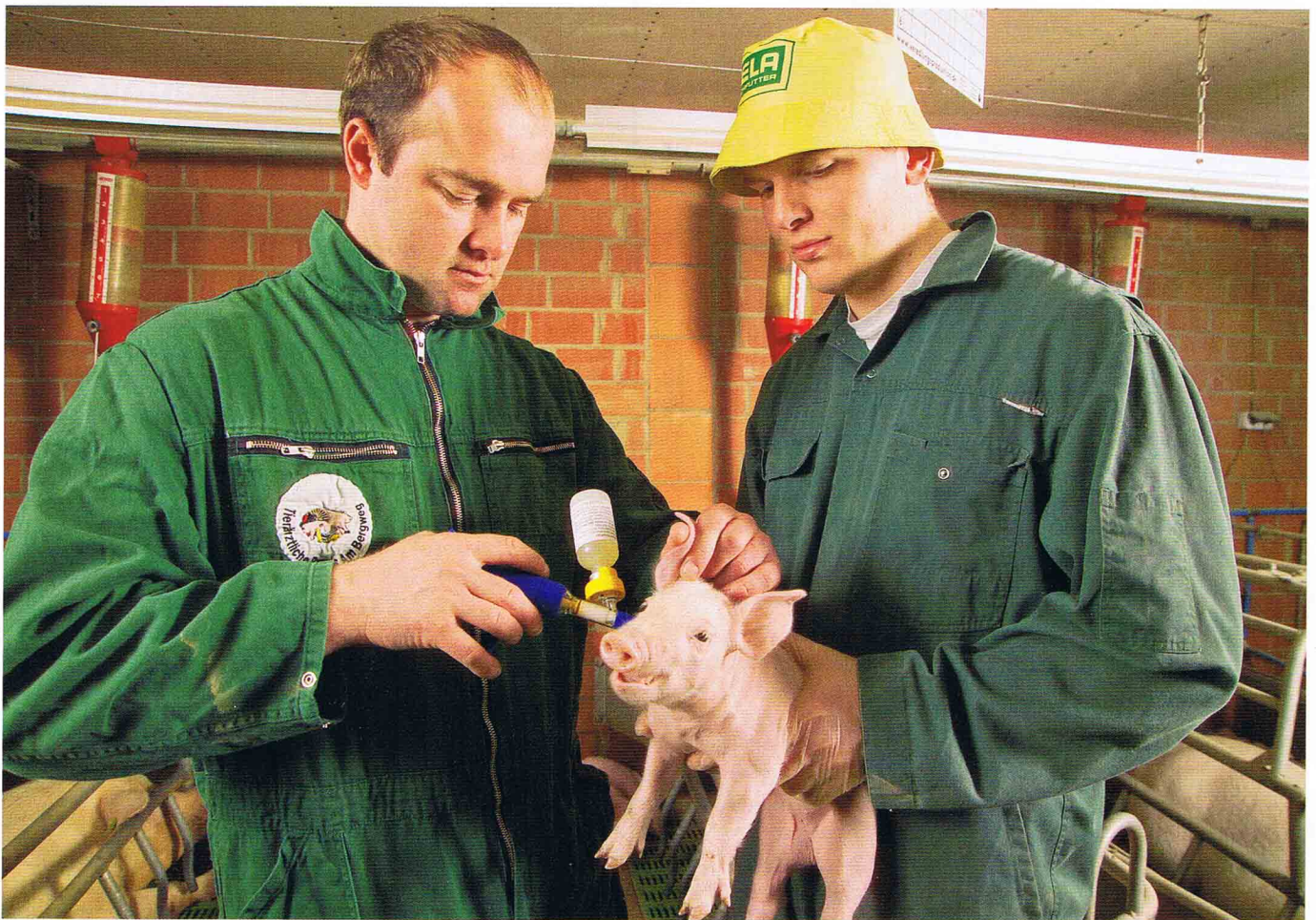
Dank der Circo-Ferkelimpfung sind die Verluste in der Aufzucht und Mast zurückgegangen.