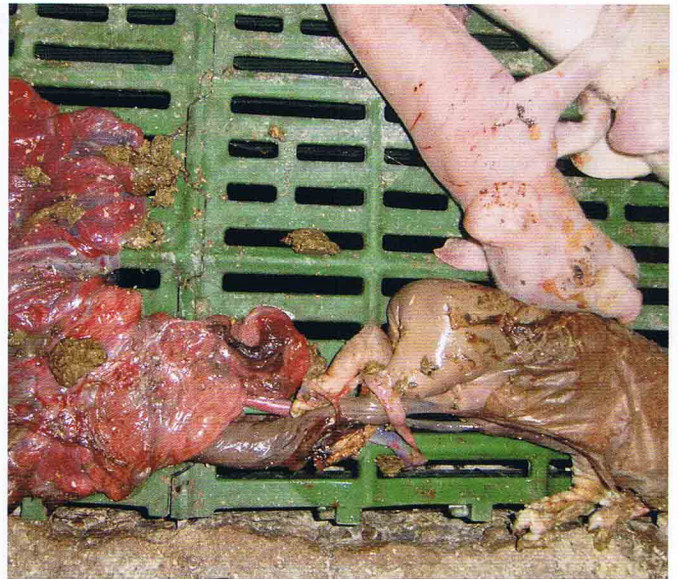
Das Circovirus kann auch Auslöser für Fruchtbarkeitsprobleme mit Aborten, Mumien und Totgeburten sein.

verschieden alten Ferkeln im Aufzuchtstall konnte ein möglicher Zusammenhang mit PCV2 festgestellt werden.